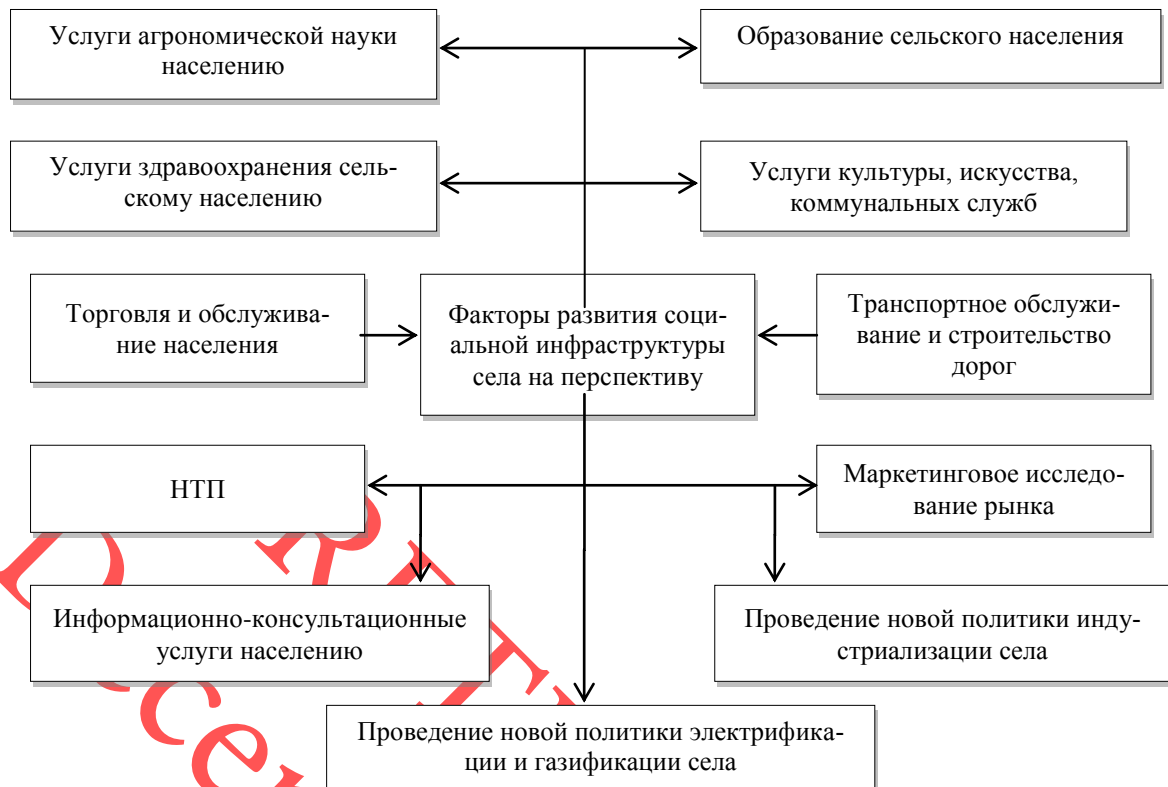
Рис. 2. Факторы развития социальной инфраструктуры села

Цель развития сельской инфраструктуры села заключается в следующем: